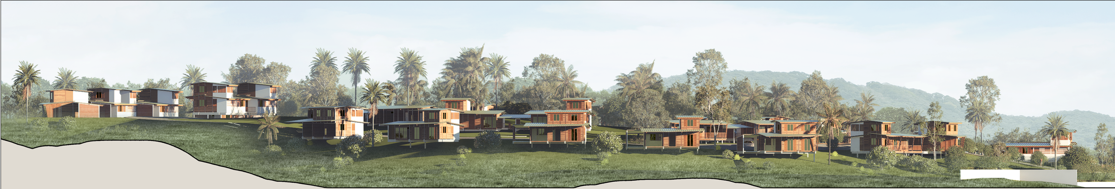
Façade longitudinale du quartier du champs de tir - 1/500ème