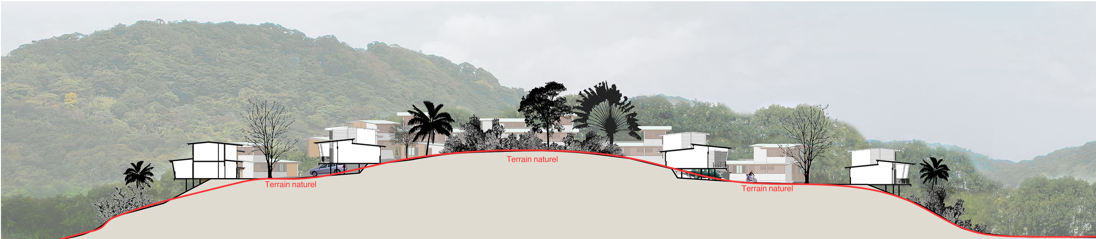
Coupe transversale du quartier du champs de tir - 1/500ème