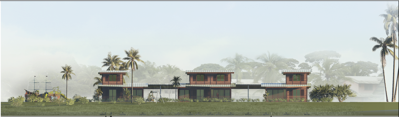
Façade longitudinale de l'extension du quartier des Pagodes - 1/500ème