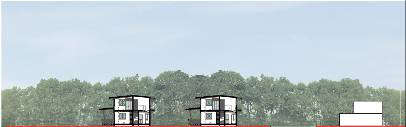
Coupe transversale de l'extension du quartier des Pagodes - 1/500ème